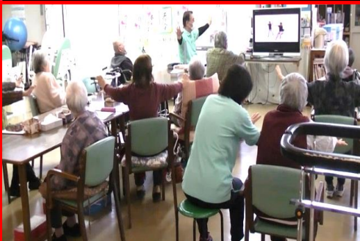
* 2月お誕生日会 ・ 体操教室 ・ マスクづくりの様子*

二月一九日 二月生まれの方のお誕生日会が行われました。新型コロナウイルスの影響でイベントを中止させて頂いていた為、この日は特に楽しんで参加されていました。また、引き続き三月もイベントを中止させて頂こうと思っております。楽しみにして下さっている方がおられる中、皆様には、深くお詫び申し上げます。重ねて、新型コロナウイルスの感染対策といたしまして、サンライフ奈良では現在、不要不急な面会は原則禁止とさせて頂いております。ご不便・ご面倒をお掛け致しますが、宜しくお願いします。