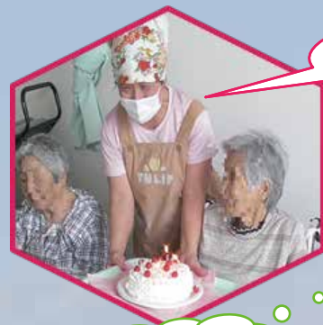
お誕生日おめでとう！