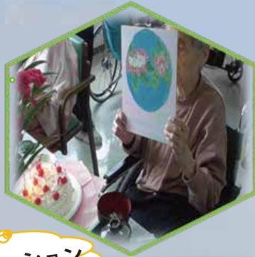
上手に出来ました！