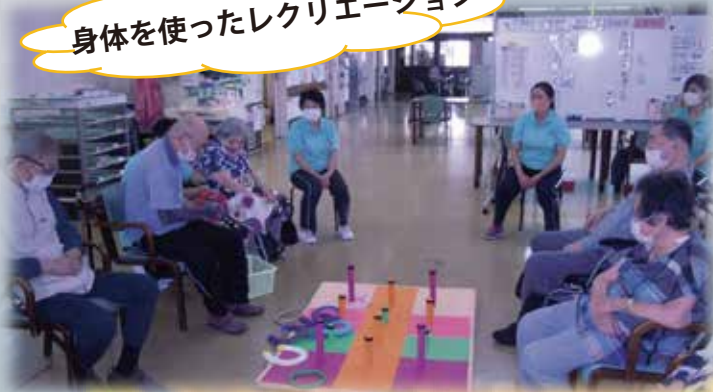
身体を使ったレクリエーション